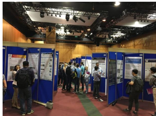
ポスター発表の様子